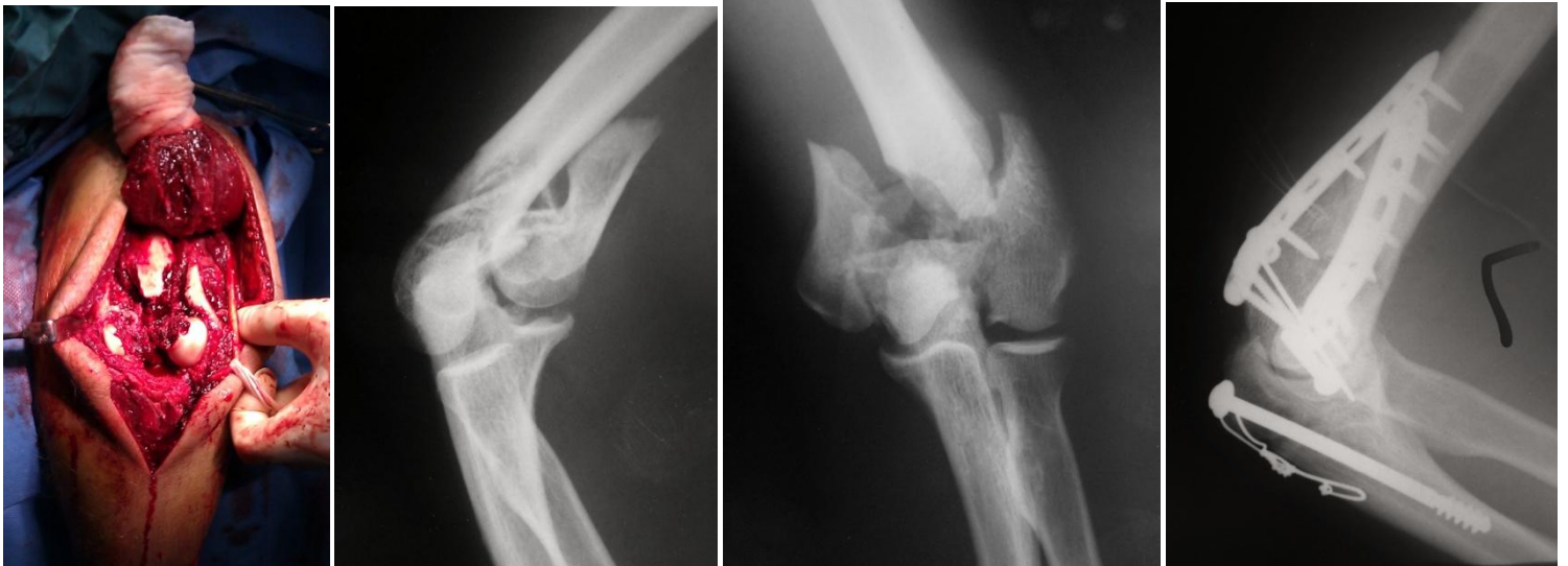
Wielofragmentowe złamanie nasady dalszej kości ramiennej – zespolenie płytą LCP.